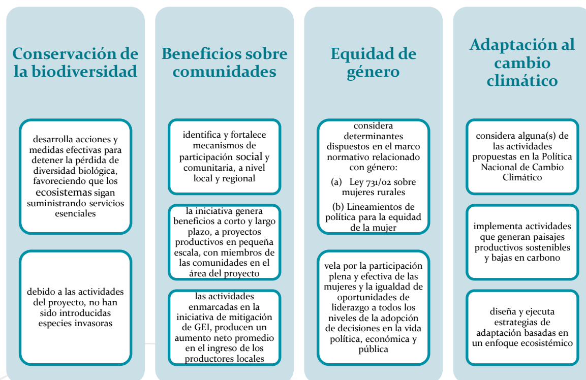
Figura 1. Requisitos de la categoría Orquídea.

la orquídea Cattleya trianae . 35 Los requisitos para obtener la Categoría Orquídea se presentan en la Figura 1.